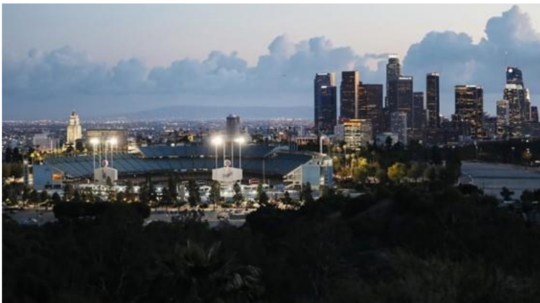
※ロサンゼルス・ドジャースのホーム球場：ドジャー・スタジアム