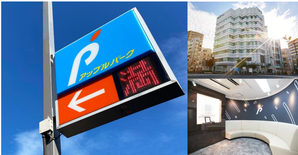
「とめる、を創る。」私たちは都市における綺麗な街づくり、スムーズな駐車を実現するために駐車場・駐輪場開発を行っております。

(アップルパーク: https://www.applepark.jp/ir/ )