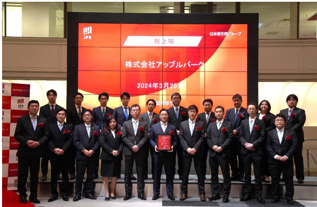
東京証券取引所で行われた上場セレモニーの様子。同社の皆様は笑顔で喜びを噛み締めていらっしゃいました。

当社の連結子会社である株式会社日本M&Aセンター(以下、日本M&Aセンター)がJ-Adviserを担当しております株式会社アップルパークが、本日、株式会社東京証券取引所(以下、東京証券取引所)が運営するTOKYO PRO Marketへ上場いたしましたことを、下記のとおりお知らせいたします。