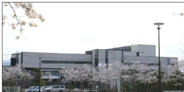
(株)ソフィア 太田事業所