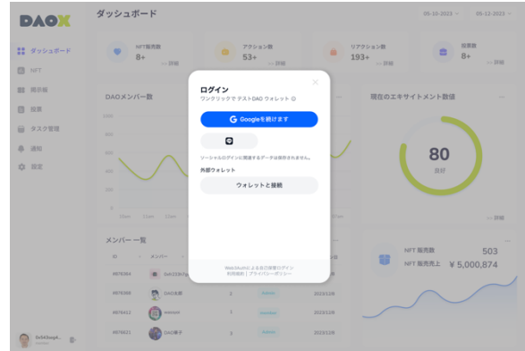
ウォレットを自動生成

※2: Non-Fungible Token の略称であり、唯一無二であると証明されたデジタルデータ