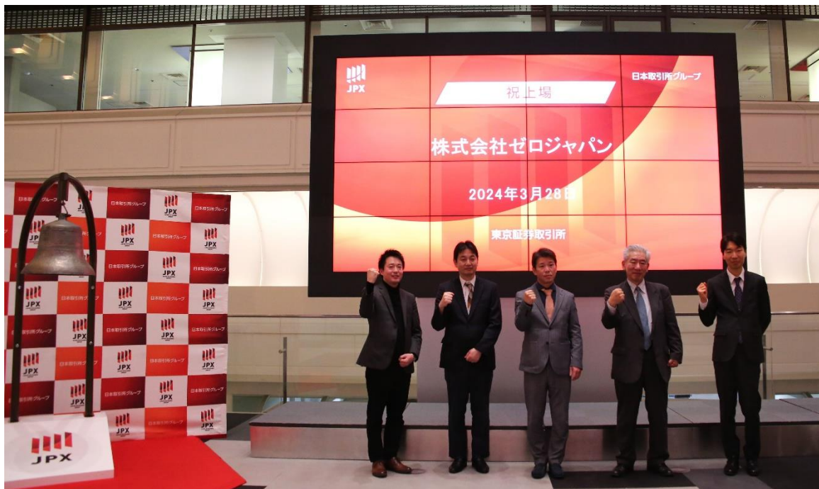
東京証券取引所にて行われた上場セレモニーの様子。セレモニーに参加された皆様はガッツポーズで上場の喜びを表現しました。

当社の連結子会社である株式会社日本M&Aセンター(以下、日本M&Aセンター)がJ-Adviserを担当しております株式会社ゼロジャパンが、本日、株式会社東京証券取引所(以下、東京証券取引所)が運営するTOKYO PRO Marketへ上場いたしましたことを、下記のとおりお知らせいたします。