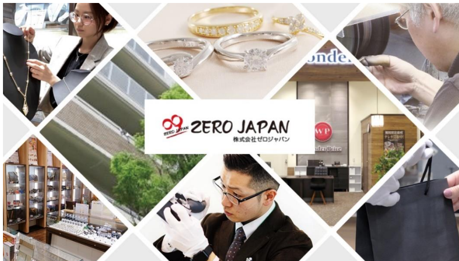
「パーターのインフラ」を合言葉に、大切にしている心を世の中に広めてまいります。