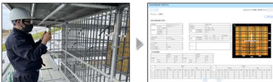
図2 配筋自動検査状況および帳票出力例

土木現場の配筋写真撮影は、作業足場上等の狭隘な作業スペースにおいて実施されることが多く、検査に必要な資機材は最小限に留めたいとの要望がありました。そこで、容易に持ち運び可能なスマートフォンやタブレット端末で撮影可能とし、検査箇所に十字マーカーを設置するだけで検査が可能なシステムを開発しました。また、撮影された映像データは、公衆回線を用いて専用サーバにアップロードされるため、検査者や立会者はどこにいても検査結果の確認ができ、帳票出力まで自動で行うシステムとしています。