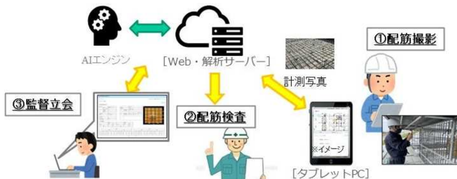
図1 配筋自動検査システムの利用概念イメージ

これにより、事前準備なしで遠隔立会時に撮影から結果帳票の出力まで一連で処理され、業務効率の改善と品質確保の確実性の両立に貢献します。