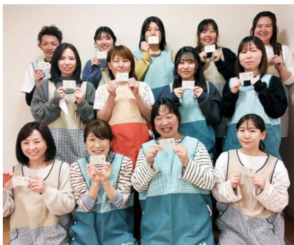
おはよう保育園 南砂町