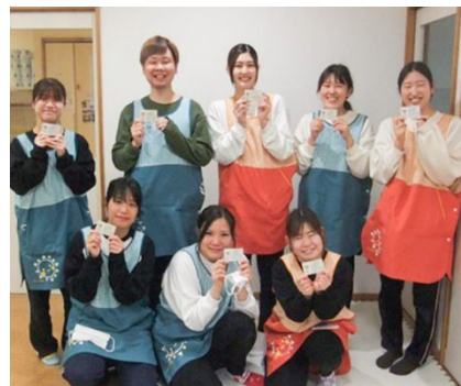
おはよう保育園 花咲町