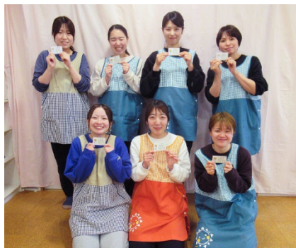
おはよう保育園 大山西町