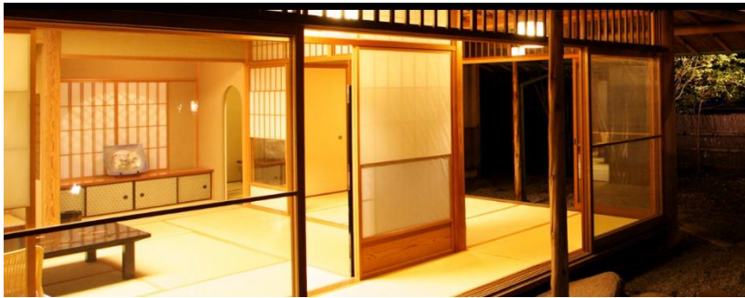
(特別室 寿苑の写真)