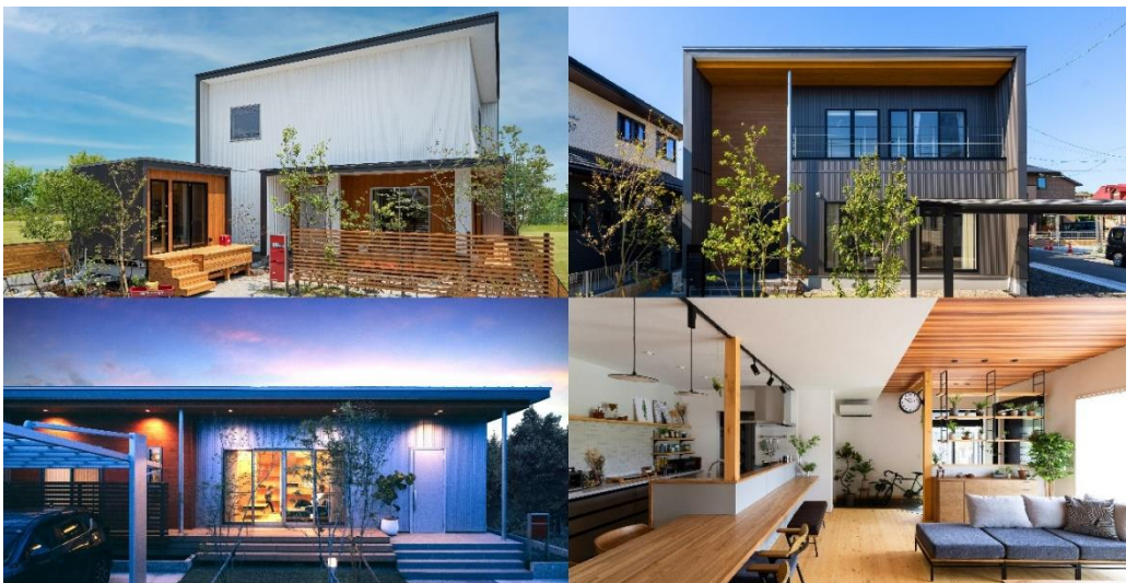
住まいを通じ、真の(NEO)豊かさの探求する事でお客様・社員・社会に貢献します。