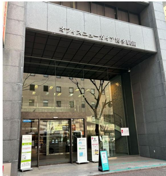
福岡事業所が入居するビルの外観