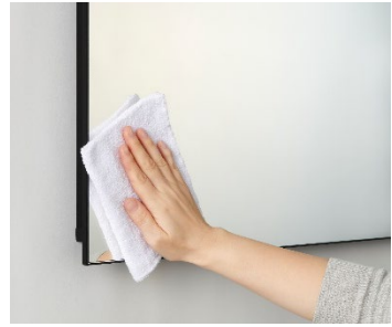
拭き掃除がしやすい構造