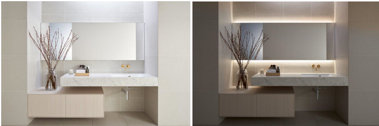
《ピッタミラー》設置イメージ

住宅設備機器と建築資材のインターネット販売を行う株式会社サンワカンパニー（所在地：大阪市北区茶屋町19-19 代表取締役社長：山根 太郎 以下、当社）は、幅450～2300mmの間でサイズオーダーが可能なミラー《ピッタミラー》を4月1日（月）に発売いたしました。近年のトレンドである幅の広い洗面台の場合にも、ミラーの横幅をぴったりと合わせることができ、デッドスペースの無い美しい洗面空間を実現します。