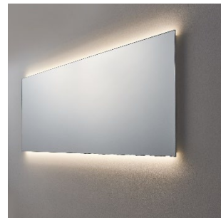
LEDあり（電球色）タイプ