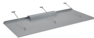
上部から見たイメージ

天面の照明器具取付部は配線コードが見えないよう配慮し、留具は庇と同色の塗装を施しました。上階から見下ろした時もすっきりとした印象です。