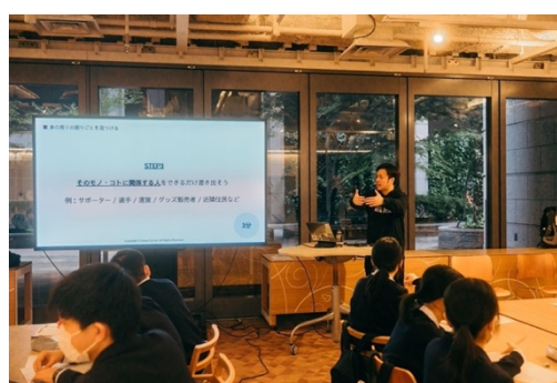
過去に開催した出前授業の様子②