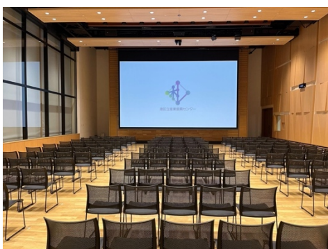
港区立産業振興センターのホール

対象(定員): 港区在住もしくは港区の学校に通う高校生・高専生・大学生(30名)