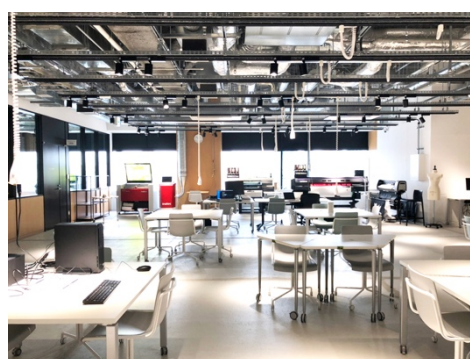
港区立産業振興センターのビジネスサポートファクトリー