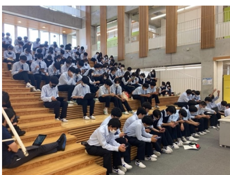
過去に開催した出前授業の様子①