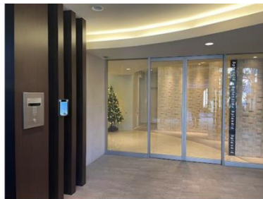
▲ スプラディッド新大阪Ⅲ