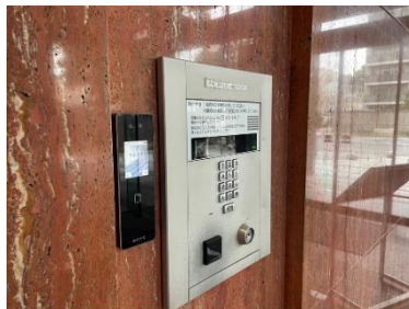
▲ タワーコート北品川