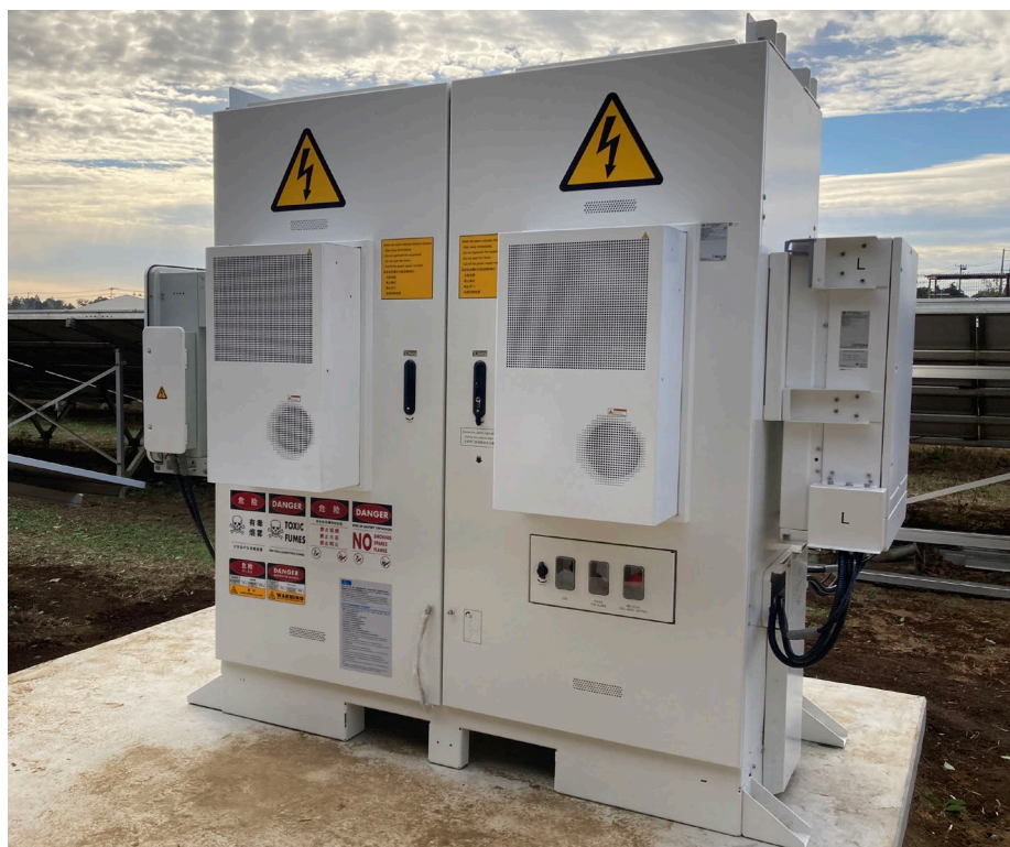
写真 新設した蓄電池