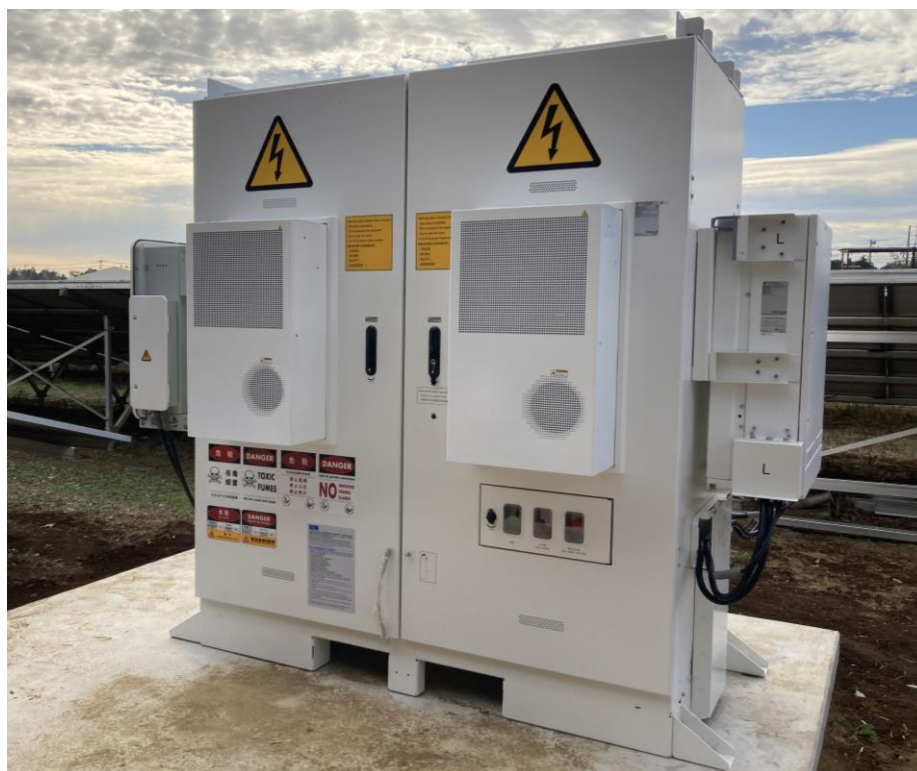
写真 新設した蓄電池