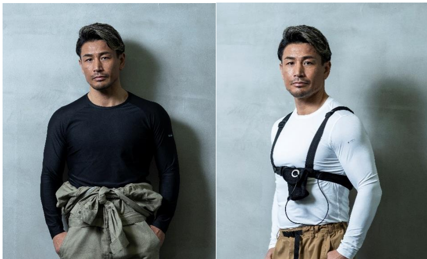
冷感シャツ 長袖クルーネック BLACK

“喜びを企画して世の中を面白くする”商品流通させる株式会社リベルタ(本社：東京都渋谷区、東証スタンダード：4935)が展開するLIDEF／クーリングウェア・ギアブランドの「フリーズテック」は、2024年4月1日より1年間、格闘技解説やタレントとしても活躍する元キックボクサーである『魔裟斗』さんがオフィシャルアンバサダーに就任することをお知らせいたします。