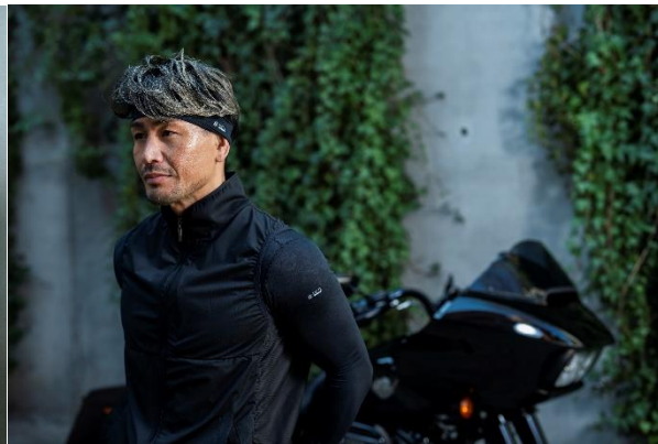
冷感ヘッドバンド BLACK 冷感シャツ 長袖クルーネック BLACK 充電式氷嚢ベスト L 001

年々夏の暑さは厳しさを増しており、それは酷暑の中で頑張る方々の体力やパフォーマンス低下にも影響がでていると言えます。水分補給・塩分補給、こまめな休憩による暑さ対策はもちろんですが、更に快適に活動ができるよう、「着る」ことで暑さ対策を提唱しているのが『フリーズテック』です。