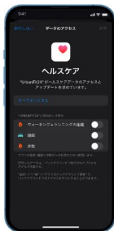
Apple社「AppleHealth」 Google社「ヘルスコネクト」連携