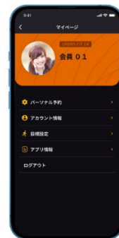
パーソナルトレーニング 予約機能