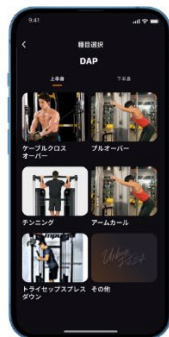
フリーウェイト系 トレーニング記録機能