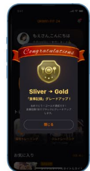
メダル獲得表示機能