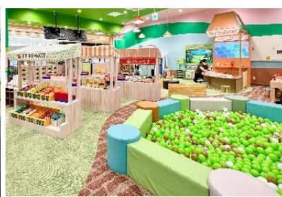
CANAL CITY HAKATA 2024