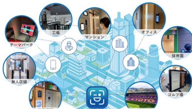
▲「FreeiD」が顔だけで、つなぐ世界

※「FreeiD」サービスサイト https://freeid.dxyz.co.jp/