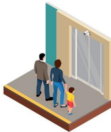
▲TAS CUBEとの連携で実現する顔認証