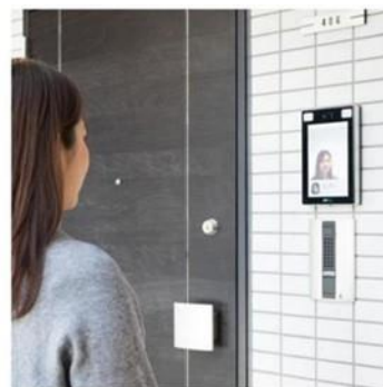
▲「オール顔認証マンション」

今回の業務提携を通じて、ティービーアイと DXYZ は、集合住宅における「TAS CUBE」ならびに「FreeID」導入加速に加え、オフィス/工場などの新たな分野における付加価値提供についても共同で推進していきます。