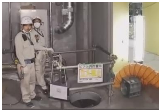
地下ピットの入口

清水建設では、これまで酸素欠乏症の危険を伴う地下ピット内作業の具体的な安全対策として、作業前日から1日かけて送風機でピットの空気が入れ替わりやすい環境にしてから、十分に換気を行ったうえで、マンホールの上から酸素濃度計を紐で括り付け測定を行っていました。すなわち、人が安全に作業開始できるまでに、多くの労力や機材等のコストを要していましたが、ELIOS 3 を導入することにより、作業員は地下ピット内に立ち入ることなく、1日かかっていた換気作業をせずに、安全な場所での目視点検が可能となり、作業効率の向上やコスト削減に貢献することを確認しました。