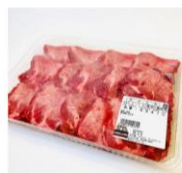
USAビーフタン厚切り焼き肉用