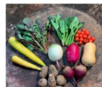
BOPISTAオリジナル西武鉄道沿線野菜セット