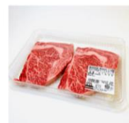
和牛4等級ロースステーキ