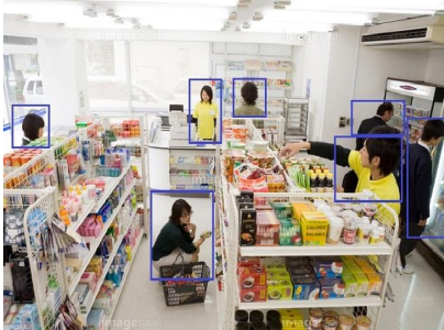
<顧客属性分析、購買分析、防犯>