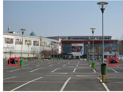
<駐車場の利用状況の把握、防犯>