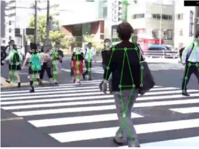
<混雑状況や動線の把握、防犯>