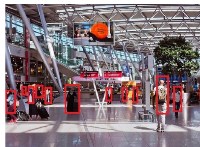
<混雑状況や動線の把握>