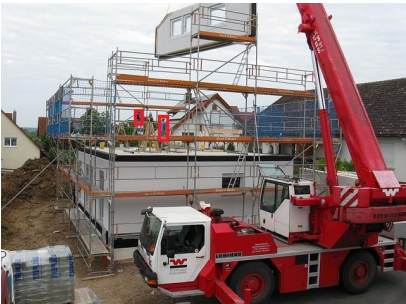
<建設現場における監視、危険検知>