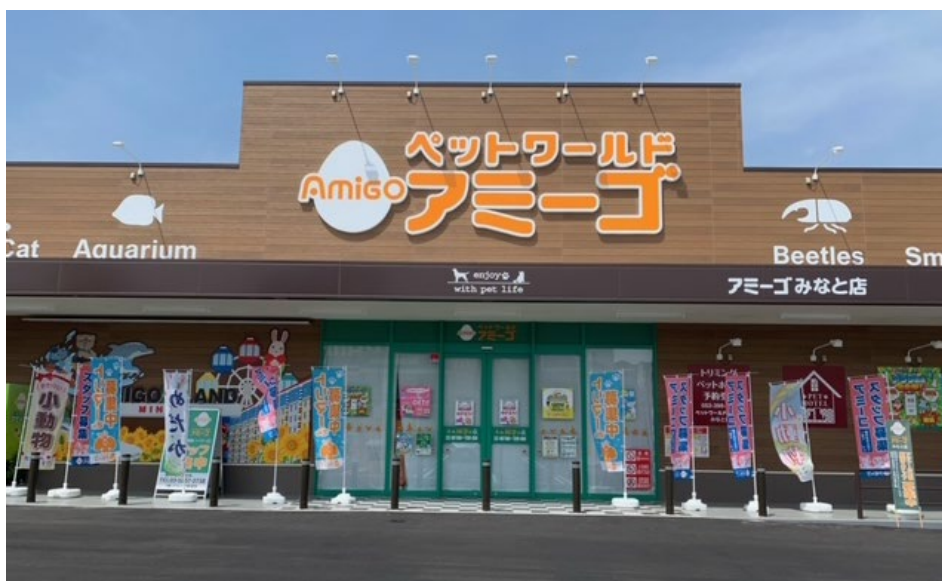
【ペットワールドアミーゴみなと店 外観】