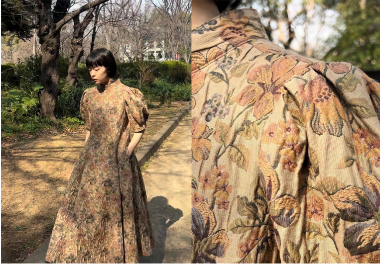
「foufou jacquard dress “viatic”」