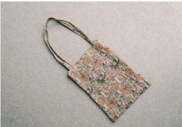
「original jacquard tote bag “viatic”(オリジナルジャカードトートバッグ “viatic”)」