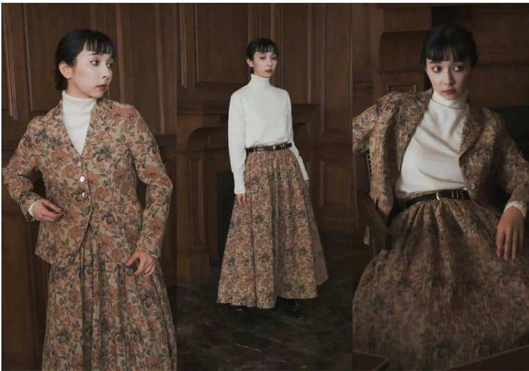
「foufou jacquard jacket “viatic”(ジャカードジャケット)」 「foufou jacquard skirt “viatic”(ジャカードスカート)」