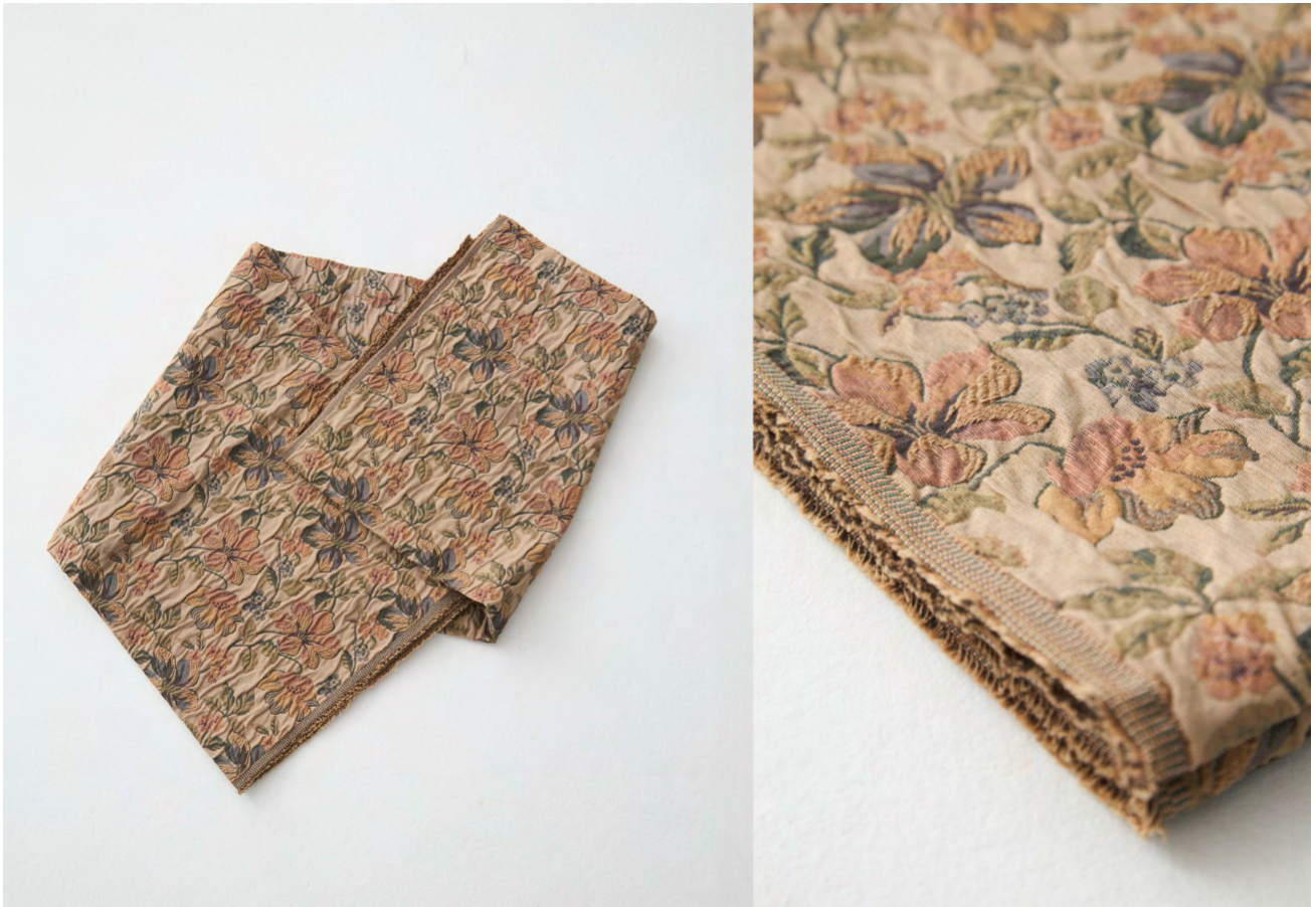
今回販売するファブリック「foufou jacquard “viatic”」

初の foufou のオリジナルファブリックとして販売するのは、ジャガード生地です。既成の生地に印刷で柄を施すプリント生地に対し、ジャガード生地は、織りや編みで柄をつくるため立体感が生まれ高級感を醸し出すことが特徴です。