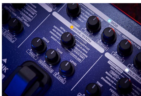
『ME-90B』ドライブ/シンセ セクション