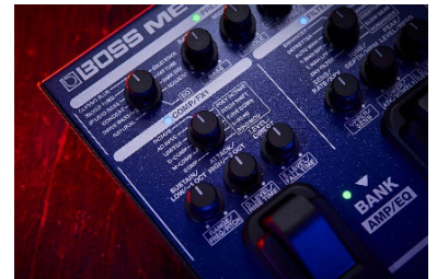
『ME-90B』コンプレッサー・セクション

『ME-90B』は、ベース用に最適なチューニングが施された 61 種類の多彩なエフェクトを搭載しています。ベーシストのマストアイテムともいえる、「コンプレッサー」や「フィルター」は複数のタイプを用意しており、「コンプレッサー」と「フィルター」の同時使用も可能です。1 オクターブ下、または 2 オクターブ下の音を追加してサウンドに厚みを加える、ベース・シンセのサウンドでリード・パートを奏するなど、表現の幅を広げるエフェクトも多く用意されています。また、エフェクトのかかっていないダイレクトなサウンドをブレンドし、芯のある音作りを可能にする「BLEND」ノブも搭載しています。