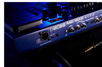
『ME-90B』XLR タイプのアウトプット端子

『ME-90B』はさまざまなベーシストの演奏環境を想定し、充実した接続端子を装備しています。標準タイプの「OUTPUT」端子に加え、PA へ直接出力することができる XLR タイプの「BALANCED OUTPUT」端子を装備。また、標準タイプの「OUTPUT」端子は、「AMP/LINE」スイッチにより、ミキサーへの直接出力も可能です。さらに、お気に入りのペダルなどを接続する「SEND/RETURN」端子、PC での録音に最適な USB Type-C 端子や、音を出すことができない環境でも演奏を楽しめるヘッドホン端子などを搭載しており、ライブ・パフォーマンスから録音、自宅練習など、さまざまなシチュエーションに対応することができます。