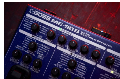
『ME-90B』プリアンプ・セクション

『ME-90B』は、当社の独自技術「AIRD」を用いて設計された高度な「プリアンプ」を搭載しています。耳馴染みのいい豊かなサウンドが特徴のクラシックなタイプから、ラウドで抜けの良いモダンなタイプ、当社オリジナルの、特に指先のニュアンスの表現に力を発揮する「NATURAL」タイプ、心地よい歪みを生み出す「DRIVE BASS」など、計 10 種類のアンプから選択することができます。