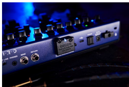
『ME-90B』オプションの Bluetooth® Audio MIDI Dual Adaptor「BT-DUAL」装着イメージ