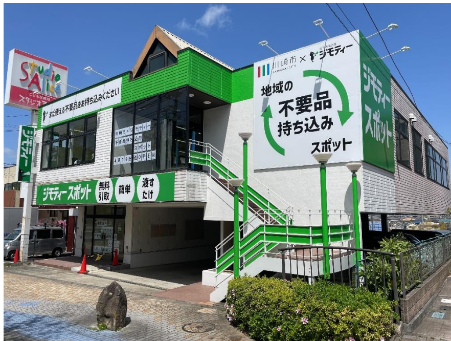
川崎市との共同事業「ジモティースポット川崎菅生店」

株式会社ジモティー（以下、ジモティー）は、神奈川県川崎市（以下、川崎市）とリユースに関する協定を新たに締結し、本日「ジモティースポット川崎菅生店」を開設します。ジモティースポット川崎菅生店は当社の運営する官民連携型のリユース拠点で初めての大型店です。これまで当社では 2022 年 10 月に開設された川崎市との官民連携のリユース拠点「ジモティースポット川崎」において、2023 年の 1 年間で約 4 万品のまだ使えるモノを必要とする人に譲渡・販売し、約 180t*のごみ減量に貢献してまいりました。また運営する 4 箇所の官民連携のリユース拠点では 2023 年の 1 年間で累計 11 万点のモノがリユースされ、ごみ減量効果は約 490t*と試算されております。