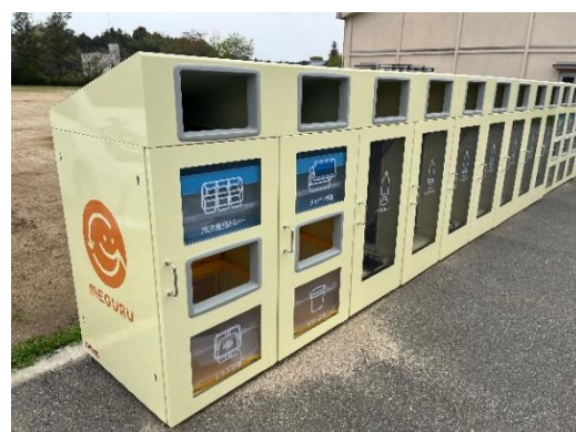
尾山地区の MEGURU STATION® に設置した MEGURU BOX®

月ヶ瀬地域は、奈良市の市街地に比べて、高齢化・人口減少が進行しています。これに伴い、買い物や医療機関、公共交通等の生活関連サービスの縮小・撤退による生活利便性の低下や、住民組織の担い手不足、地域コミュニティの機能低下等が懸念されています。こうした背景から、奈良市は、月ヶ瀬地域における持続可能な地域社会の構築に向けて、「Local Coop 大和高原プロジェクト」を推進しています。