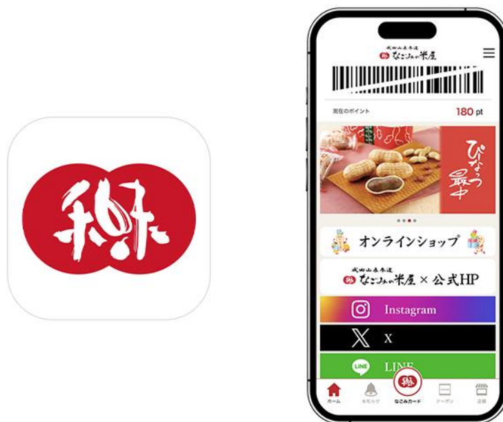
図1 『なごみの米屋公式アプリ』アイコンとトップ画面

その他にも、アプリ会員限定クーポンやお得な最新情報が届き、キーワード・GPSによる店舗検索ができるなど、便利な機能を搭載しています。また、アプリから手軽にオンラインショップも利用できます。