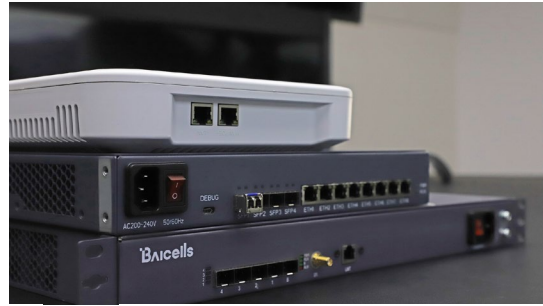
sXGP 対応小型無線装置