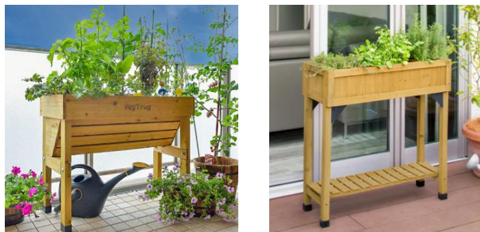
【左：ベジトラグ ウォールハガー S、右：ハーブプランタースリム】

イギリス生まれの菜園プランター「ベジトラグ」や、根が張るハーブ類を種類別に育てられる「ハーブプランター」など。「RHS（英国王立園芸協会）」より、家庭菜園の普及による脱炭素への貢献と健康的で豊かな暮らしの実現が評価され、推奨商品に認定されています。