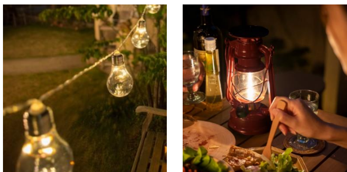
【左：電池式パーティーライト 10 球、右：あかりクラシック ルミエールランタン】