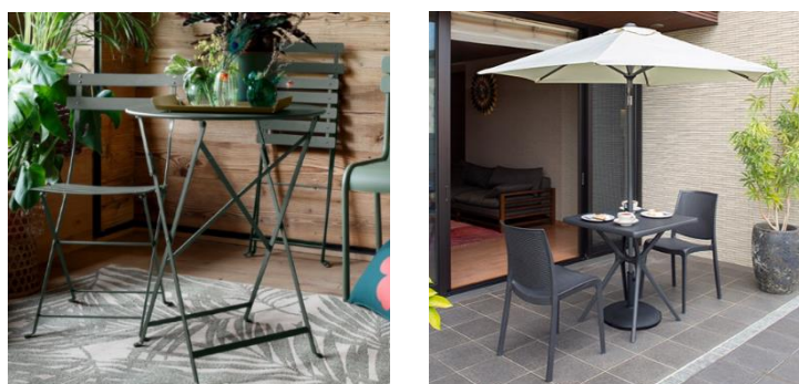
【左：フェルモブ ビストロシリーズ、右：ボスコシリーズ】

まるでカフェにいるような時間を創り出すフランスのガーデンファニチャーブランド「Fermob（フェルモブ）」、タカショーオリジナルデザインの「Bosco（ボスコ）」など、実際に座ってお試しいただけます。