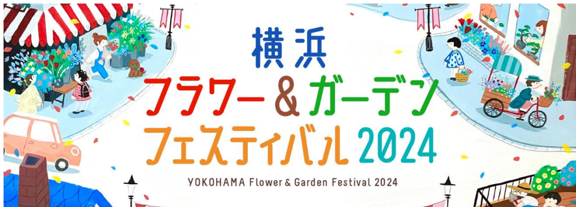
【『横浜フラワー&ガーデンフェスティバル』 イメージ】

会場では、イギリスの「RHS（英国王立園芸協会）」から日系企業として初めて推奨商品に認定されたタカショーグループ「VegTrug（ベジトラグ）社」の菜園プランターをはじめ、園芸ツールやガーデンファニチャーをご紹介。お客様に商品やブランドを体感していただき、認知拡大およびお客様との新たな接点創出を目指します。