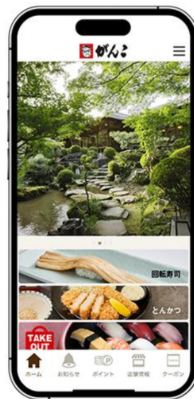
図1 『がんこ公式アプリ』アイコンとトップ画面