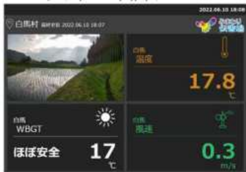
<サイネージ画面イメージ>